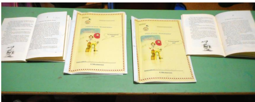
Το λογοτεχνικό εγχειρίδιο των παιδιών, βασισμένο στο βιβλίο «Η Έμπνευση μου είπε να σας πω... δέκα παραμύθια και μισό» του συγγραφέα Βαγγέλη Ηλιόπουλου.