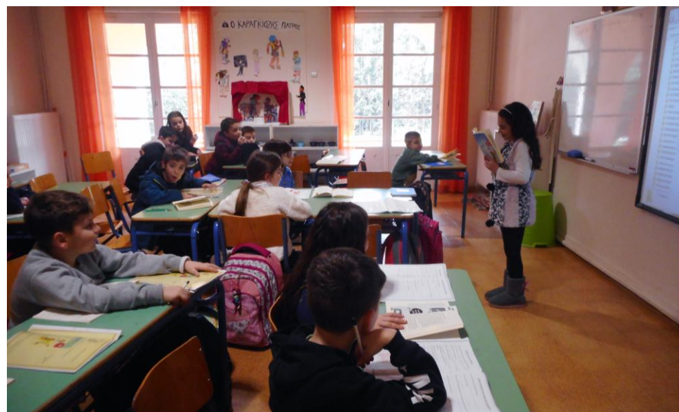
Ώρα αφιερωμένη στη λογοτεχνία.