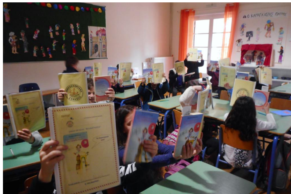
Καμαρώνουμε για το λογοτεχνικό μας εγχειρίδιο!

Επιπλέον κάθε Παρασκευή, μετά τη γραπτή έκθεση, οι μαθητές κάνουν μέσα στην τάξη βιβλιοπαρουσίαση του αγαπημένου τους βιβλίου, το οποίο φέρνουν από το σπίτι. Σημειωτέον ότι, όποιο παιδί επιθυμεί, δανειζεται το βιβλίο που θέλει από τη δανειστική βιβλιοθήκη του σχολείου.